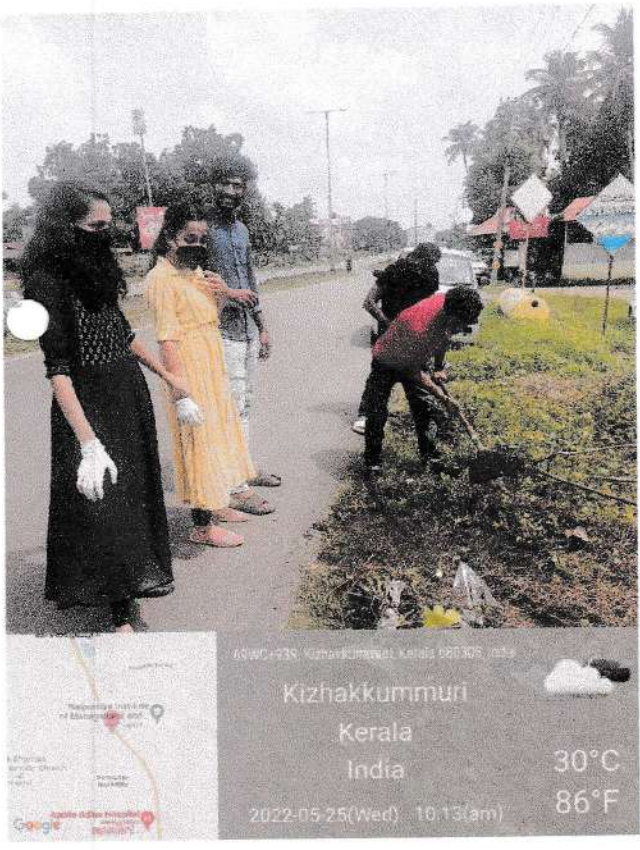
National Highway cleaning