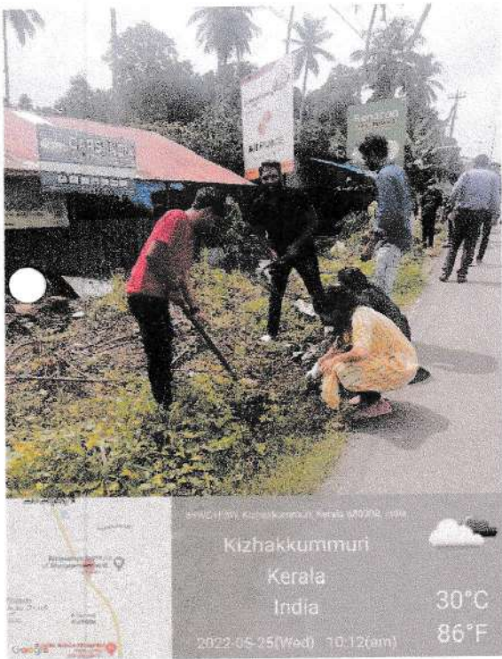
National Highway cleaning